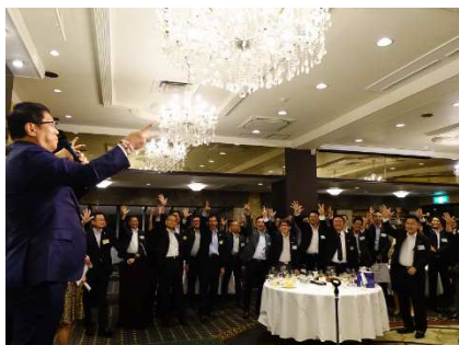
<抽選会・じゃんけん大会>