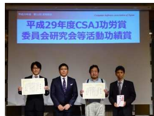
<総会後の表彰式の様子>