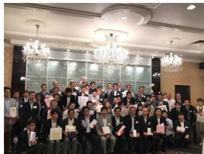
<豪華賞品をゲットした皆様>

CSAJ 理事や会員企業参加者との名刺交換で人脈を拡大。豪華景品を提供して自社をアピール(じゃんけん大会に参加することもできます)。参加して豪華賞品をゲット!・・・など楽しさも盛りだくさんです。