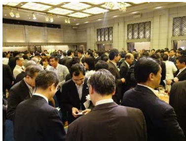
<会場内の懇談の様子>