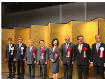
<レセプション風景>

これまで「最先端 IT・エレクトロニクス総合展」として開催してきた CEATEC JAPAN は、2016 年より「CPS/IoT でつながりが深まる社会、新たにもたらされる未来を共に創り出す場」をテーマに「CPS/IoT Exhibition」へと生まれ変わりました。CSAJ では、特別展示やカンファレンスなども企画運営しています。