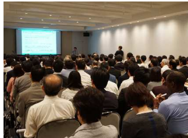
<CSAJ 企画カンファレンス会場>

CSAJ 会員は、会員特別価格で出展することができます。約 15 万人の来場者へのプロモーションに活用いただけます。