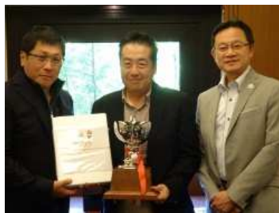
<優勝者と荻原会長、交流委員長>