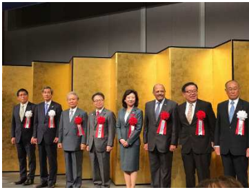
<レセプション風景>

これまで「最先端 IT・エレクトロニクス総合展」として開催してきた CEATEC JAPAN は、2016 年より「CPS/IoT でつながりが深まる社会、新たにもたらされる未来を共に創り出す場」をテーマに「CPS/IoT Exhibition」へと生まれ変わりました。CSAJ では、特別展示やカンファレンスなども企画運営しています。