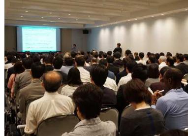
<CSAJ 企画カンファレンス会場>

CSAJ 会員は、会員特別価格で出展することができます。約 15 万人の来場者へのプロモーションに活用いただけます。