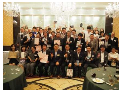
＜豪華賞品をゲットした皆様＞

CSAJ理事や会員企業参加者との名刺交換で人脈を拡大。豪華景品を提供して自社をアピール（じゃんけん大会に参加することもできます）。参加して豪華賞品をゲット!・・・など楽しさも盛りだくさんです。