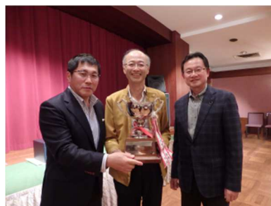
<優勝者と荻原会長、交流委員長>