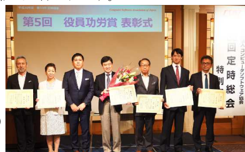
<総会後の表彰式の様子>