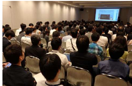
<CSAJ 企画カンファレンス会場>

CSAJ 会員は、会員特別価格で出展することができます。約 15 万人の来場者へのプロモーションに活用いただけます。