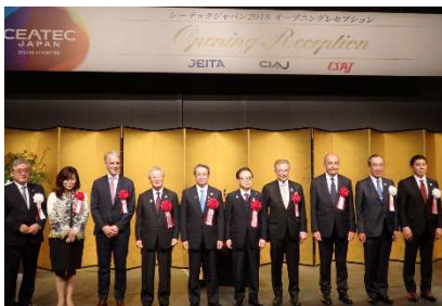
<レセプション風景>

社会を支えるテクノロジーから、それらを活用するサービスまでが集結し、未来を見据えたコンセプトや新しいビジネスモデルを発信する CEATEC は、あらゆる産業・業種による「CPS/IoT」と「共創」をテーマとしたビジネス創出のための、人と技術・情報が一堂に会する場とし、経済発展と社会的課題の解決を両立する「超スマート社会(Society 5.0)」の実現を目指します。